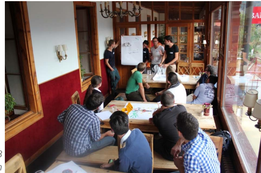
BeX Camp 2013 à Chandolin

3. Appréhension du travail en équipes multidisciplinaires