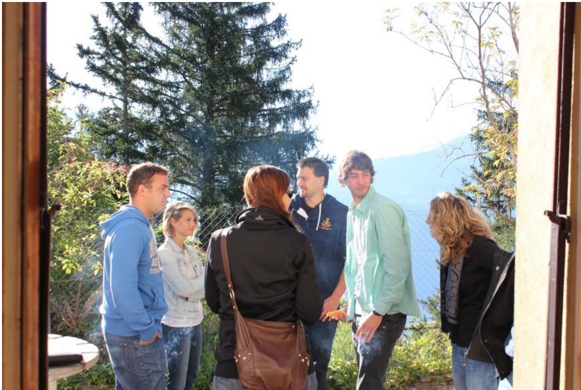
BeX Camp 2012 à Montana