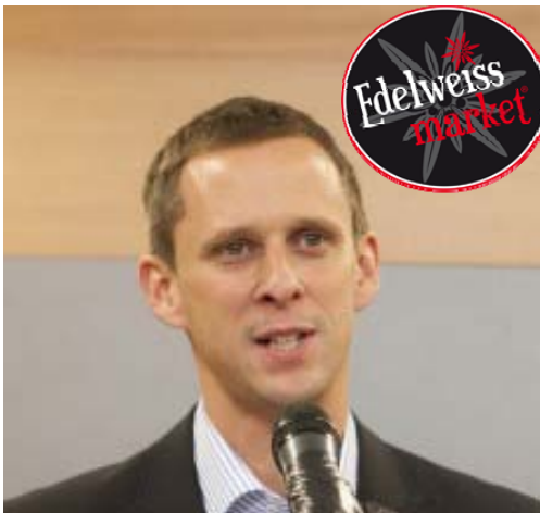
MIX & REMIX