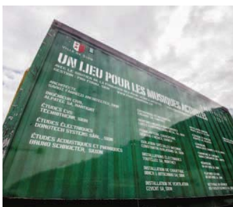
L'espace se construit dans la zone industrielle de Sion.