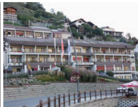
La résidence Saint-Sylve a été le théâtre d'une descente de police en septembre dernier. L'enquête est toujours en cours. LE NOUVELLISTE

Avant l'ouverture officielle, le comité de l'association a encore tenu à organiser deux soirées «Avant les murs» en guise de mise en bouche. La première se déroulera le 27 décembre au Dolmen et résonnera aux sons electro, rock et blues. ● FDR