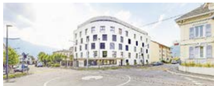
Le nouveau Swiss Resort à Aigle.