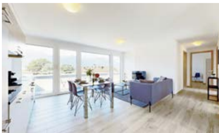
Un des appartements de la résidence hôtelière du Chablais.

Le Swiss Resort propose 40 studios et 16 appartements à Aigle. Le prix de location oscille entre 60 et 120 francs en courte durée et entre 1350 et 1750 francs pour une location mensuelle avec service. L'établissement n'a pas encore été classifié par HôtellerieSuisse mais vise les 3 étoiles. Un restaurant, géré indépendamment, doit ouvrir dans le courant de 2021. Le coût global de la réalisation est de 10 millions de francs investis par le propriétaire, le groupe Mutuel. cj